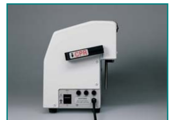
Abb. 4: Ein/Aus und CPR- Schalter

Das Pumpaggregat arbeitet leise und vibrationsarm. Aufgrund der Verwendung von neuesten technischen Konzepten ist das System sehr wartungsfreundlich und weitgehend störungsfrei.