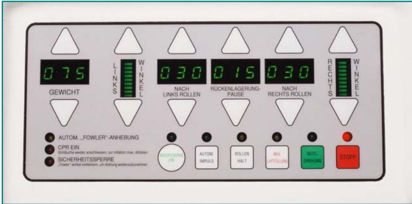
Abb. 5: Sensor-Bedienungstasten

Das Bedienungspaneel des Pulmo-Dyn Rotationssystems zeigt alle programmierbaren Variablen und Therapie-Optionen auf.