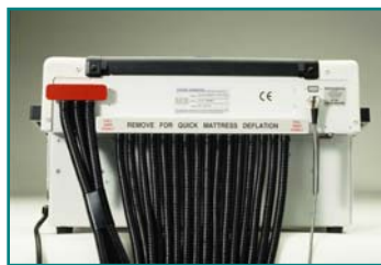
Abb. 2: Konnektor mit den 16 Luftzuleitungen