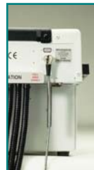
Abb. 3: Stecker für den automatischen Rotationsstopp