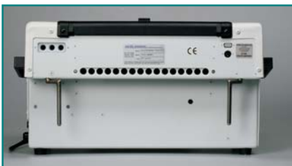
Abb. 1: Gehäuse Rückansicht

Das Pumpaggregat besteht aus einem robusten, schalldämpfenden Kunststoffgehäuse mit einer Turbine und einem mikroprozessorkontrollierten Steuerungssystem. Die Hauptschalter "Ein / Aus" Taste befindet sich an der rechten Seite des Pumpaggregates. Auf der Rückseite des Gehäuses befinden sich die Aufhängung, die Konnektoren für die Schlauchanschlüsse der Matratze und das Typenschild.