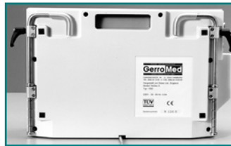
Abb. 3: Gehäuse Rückansicht

Das Pumpaggregat arbeitet extrem leise und vibrationsarm. Aufgrund der Verwendung von neuesten technischen Konzepten (beispielsweise elektropneumatischen Ventilen), ist das System sehr wartungsfreundlich und weitgehend störungsfrei.