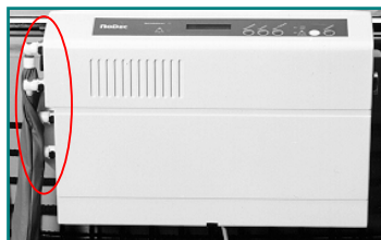
Abb. 7: Konnektoren mit Anschlüssen

Verbinden Sie die selbstschließenden Schlauchkonnektoren der Matratze mit den Anschlüssen an der linken Seite des Pumpaggregats. Ein hörbares Klicken bestätigt die feste Verbindung. Der beiden unteren Konnektoren haben einen kleineren Durchmesser als die restlichen Konnektoren, damit ein Vertauschen der Anschlüsse ausgeschlossen werden kann.