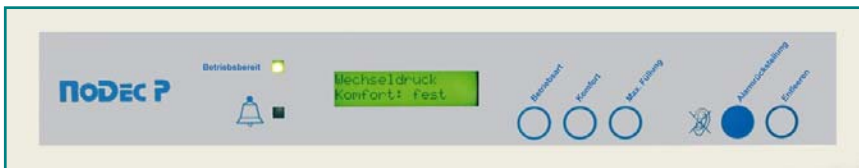
Abb. 4: Sensor-Bedienungstasten

Alle Bedienungstasten sind zu drücken, bis ein Quittierton die Annahme des Befehls bestätigt. Dies wird im Display angezeigt, um etwaige Fehlbedienungen zu vermeiden. Die 5 Tasten haben folgende Funktionen: