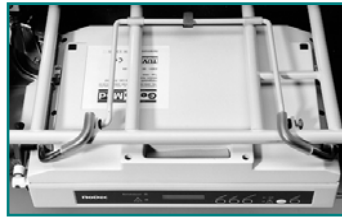
Abb. 6: Pumpenaggregat unter dem Bett hängend (optional)