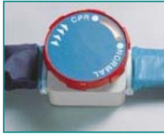
Abb. 8: CPR - Ventil

Bei Herzstillstand des Patienten können Sie die Matratze rasch entleeren, indem Sie das Drehelement des CPR -Ventils im Uhrzeigersinn nach rechts drehen. Die Entleerungszeit beträgt bis zur möglichen Herzmassage ca. 10 - 15 Sekunden.