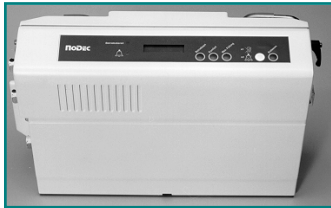
Abb. 1: Gehäuse Frontansicht