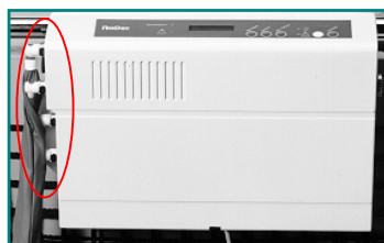
Abb. 7: Konnektoren mit Anschlüssen

Verbinden Sie die selbstschließenden Schlauchkonnektoren der Matratze mit den Anschlüssen an der linken Seite des Pumpaggregats. Ein hörbares Klicken bestätigt die feste Verbindung. Der beiden unteren Konnektoren haben einen kleineren Durchmesser als die restlichen Konnektoren, damit ein Vertauschen der Anschlüsse ausgeschlossen werden kann.