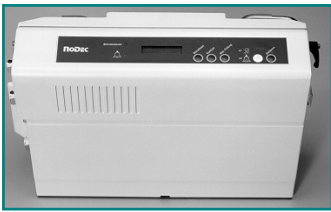
Abb. 1: Gehäuse Frontansicht