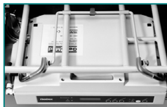
Abb. 6: Pumpenaggregat unter dem Bett hängend (optional)