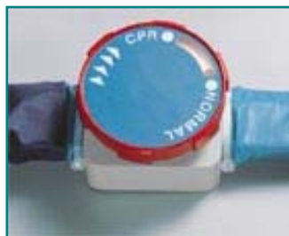
Abb. 9: CPR - Ventil

Bei Herzstillstand des Patienten können Sie die Matratze rasch entleeren, indem Sie das Drehelement des CPR -Ventils im Uhrzeigersinn nach rechts drehen. Die Entleerungszeit beträgt bis zur möglichen Herzmassage ca. 10 - 15 Sekunden.