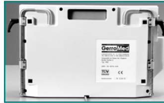
Abb. 3: Gehäuse Rückansicht

Das Pumpaggregat arbeitet extrem leise und vibrationsarm. Aufgrund der Verwendung von neuesten technischen Konzepten (beispielsweise elektropneumatischen Ventilen), ist das System sehr wartungsfreundlich und weitgehend störungsfrei.