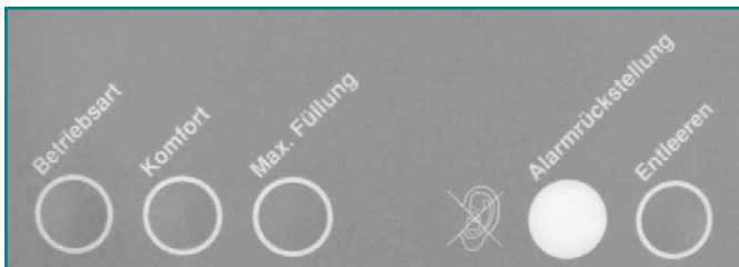
Abb. 4: Sensor-Bedienungstasten

Alle Bedienungstasten sind zu drücken, bis ein Quittierton die Annahme des Befehls bestätigt. Dies wird im Display angezeigt, um etwaige Fehlbedienungen zu vermeiden. Die 5 Tasten haben folgende Funktionen: