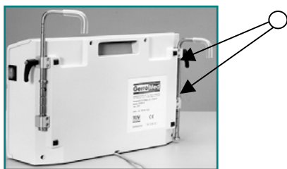
Abb. 5: Rückseite des Gehäuses mit aufgeklappten Aufhängungen

Das Pumpaggregat kann am Fußende des Bettes aufgehängt oder auf den Boden gestellt werden. Es kann senkrecht (Hängehöhe 30 cm - 37,5 cm) mit Hilfe der Klick-Stop-Rillen an den Hängevorrichtungen in 2 cm-Abständen justiert werden.